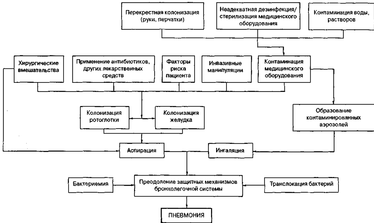
Рис. 1. Схема патогенеза НП [10]